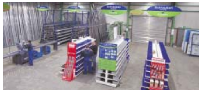
ProKilo® auch in Oberhausen, Graf-Zeppelin-Straße 7, Nähe Stadion

Das Problem kennen viele Handwerker und Gewerbetreibende genauso wie ambitionierte Bastler und Heimwerker: Es wird nur ein kleines Stück Blech oder Stahlprofil z.B. für eine Ausbesserungsarbeit benötigt, aber im Großhandel sind Metalle und Kunststoffe nur als ganze Tafeln oder in den festen Handelslängen erhältlich.